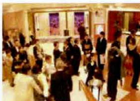
●ホテルや結婚式場で