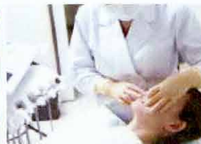
●病院や歯科医院で