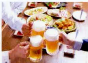
●居酒屋やファミリーレストランで