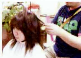
●美容室や理髪店で