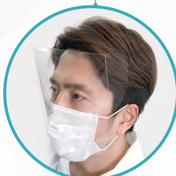
罫線A・Bを折った際の 装着イメージ