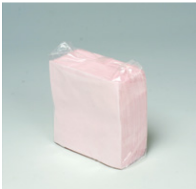
商品 CD : 902589 名称 : カラーナプキン 四ツ折(ピンク) 入数 : 500枚パック(10 パック 5,000枚) 原紙 SIZE : 250×250mm