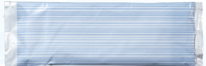
商品CD：371400 品番：T-9 商品名：フレッシュメイト ハイグレード [平] 入数：1,000 原紙SIZE：185×260mm