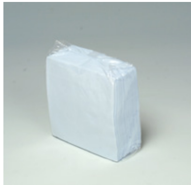
商品 CD : 902593 名称 : カラーナプキン 四ツ折(パープル) 入数 : 500枚パック(10 パック 5,000枚) 原紙 SIZE : 250×250mm