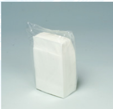
商品 CD : 31005 名称 : 六ツ折 Eタイプ 入数 : 10,000 (100×100) 原紙 SIZE : 245×250mm