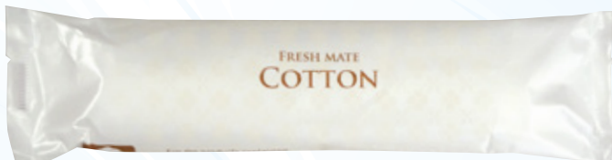
商品CD : 371413 品番 : CO-3 商品名 : フレッシュメイト COTTON [L丸] 入数 : 800 原紙SIZE : 250×320mm