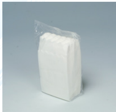
商品 CD : 31006 名称 : 六ツ折 Eタイプ 山型 入数 : 10,000 (100×100) 原紙 SIZE : 245×250mm