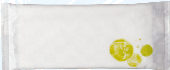
商品CD：371402 品番：T-10 商品名：フレッシュメイト ハイグレード [平] Lタイプ 入数：800 原紙SIZE：250×270mm ※受注生産 5 c/s～