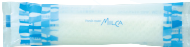
商品CD : 371215 品番 : MC-1 商品名 : フレッシュメイト ミルクカートン [丸] 入数 : 1,200 原紙SIZE : 250×200mm