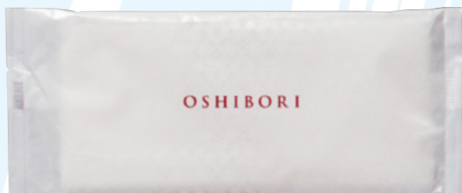
商品CD : 374235 品番 : J-4 商品名 : フレッシュメイト ステアラ [平] Lタイプ 入数 : 1,000 原紙SIZE : 250×270mm