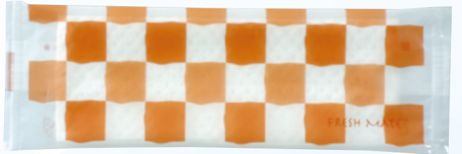
商品CD : 371304 品番 : FM-2L 商品名 : フレッシュメイト [平] 香料入 入数 : 1,500 原紙SIZE : 185×260mm ※受注生産 5 c/s～