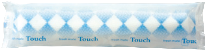
商品CD：371422 品番：T-1 商品名：フレッシュメイト ハイ・タッチ [丸] 入数：1,200 原紙SIZE：260×200mm