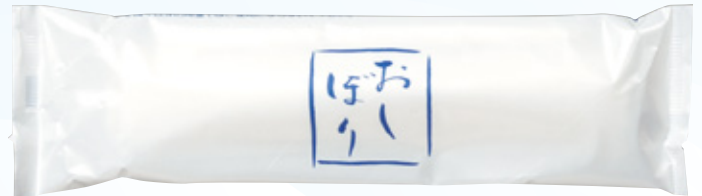
商品CD：371221 品番：T-7 商品名：フレッシュメイト ハイグレード [丸] Lタイプ おしぼり柄 入数：800 原紙SIZE：250×320mm