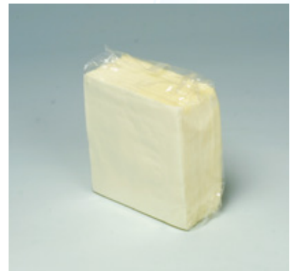
商品 CD : 902591 名称 : カラーナプキン 四ツ折(イエロー) 入数 : 500枚パック(10 パック 5,000枚) 原紙 SIZE : 250×250mm