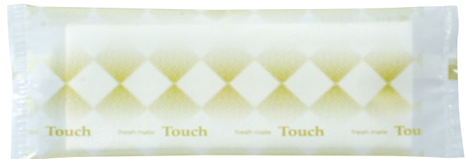
商品CD：371421 品番：T-4 商品名：フレッシュメイト タッチ [平] 入数：1,500 原紙SIZE：185×260mm