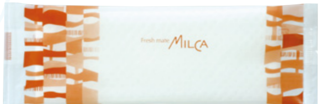
商品CD : 371216 品番 : MC-2 商品名 : フレッシュメイト ミルクカートン [平] 入数 : 1,500 原紙SIZE : 185×260mm