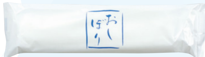
商品CD : 374220 品番 : M-26 商品名 : フレッシュメイト ピュア [丸] Lタイプ おしぼり柄 入数 : 800 原紙SIZE : 250×320mm