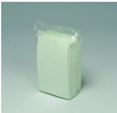
商品 CD : 902587 名称 : カラーナプキン 六ツ折(グリーン) 入数 : 500枚パック(10 パック 5,000枚) 原紙 SIZE : 250×250mm