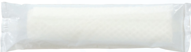
商品CD : 371219 品番 : FM-3 商品名 : フレッシュメイト 紙タイプ [丸] 乳白無地 入数 : 1,200 原紙SIZE : 250×185mm