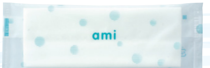
商品CD : 370136 品番 : A-2 商品名 : フレッシュメイト アミー [平] 入数 : 1,500 原紙SIZE : 185×260mm