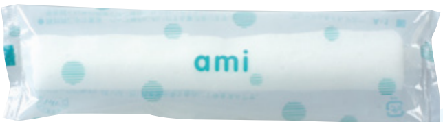
商品CD : 370135 品番 : A-1 商品名 : フレッシュメイト アミー [丸] 入数 : 1,200 原紙SIZE : 250×200mm