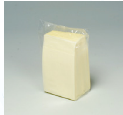
商品 CD : 902586 名称 : カラーナプキン 六ツ折(イエロー) 入数 : 500枚パック(10 パック 5,000枚) 原紙 SIZE : 250×250mm