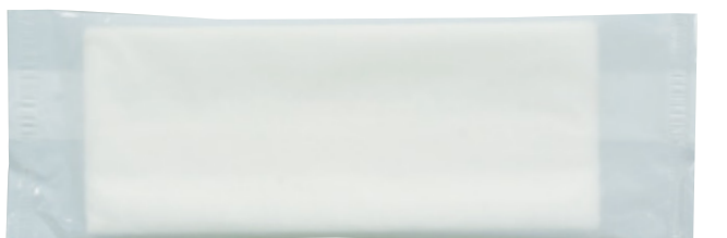
商品CD : 370121 品番 : A-6 商品名 : フレッシュメイト 不織布 [平] 乳白無地 入数 : 1,500 原紙SIZE : 185×250mm