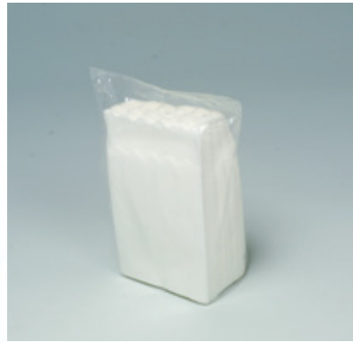
商品 CD : 0031100 名称 : 六ツ折 山型 入数 : 10,000 (100×100) 原紙 SIZE : 250×250mm