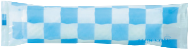
商品CD : 370206 品番 : FM-1 商品名 : フレッシュメイト [丸] 入数 : 1,200 原紙SIZE : 250×200mm