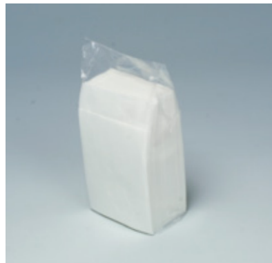
商品 CD : 31719 名称 : 六ツ折 ミルカ 無地 入数 : 10,000 (100×100) 原紙 SIZE : 250×250mm