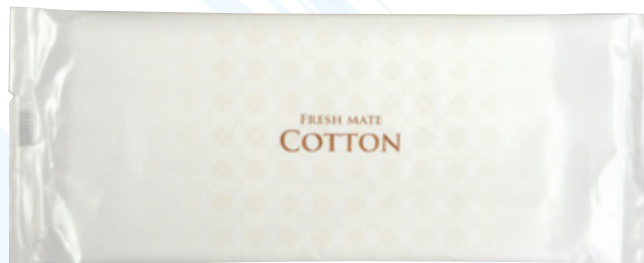
商品CD : 371414 品番 : CO-4 商品名 : フレッシュメイト COTTON [L平] 入数 : 800 原紙SIZE : 250×270mm