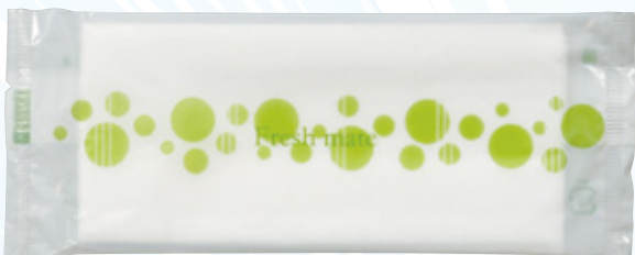
商品CD : 371398 品番 : A-7 商品名 : フレッシュメイト Eタイプ [平] 入数 : 2,000 原紙SIZE : 185×220mm