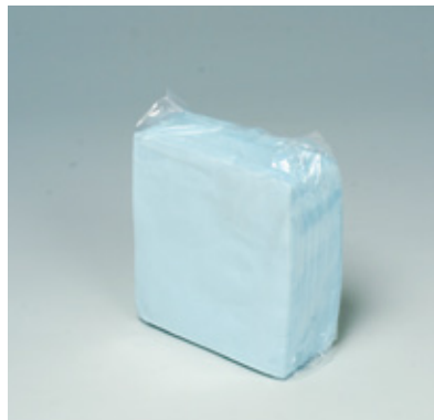
商品 CD : 902590 名称 : カラーナプキン 四ツ折(ブルー) 入数 : 500枚パック(10 パック 5,000枚) 原紙 SIZE : 250×250mm