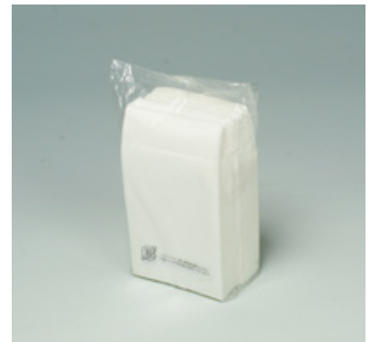
商品 CD : 31215 名称 : 新四ツ折 ミルカ 入数 : 15,000 (150×100) 原紙 SIZE : 165×250mm