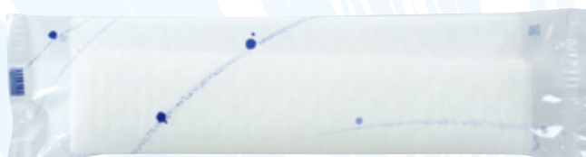
商品CD : 374201 品番 : P-1 商品名 : フレッシュメイト ピュア [丸] 入数 : 1,000 原紙SIZE : 250×200mm