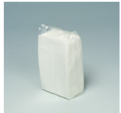
商品 CD : 31717 名称 : 新六ツ折 観音開 入数 : 15,000 (150×100) 原紙 SIZE : 165×250mm