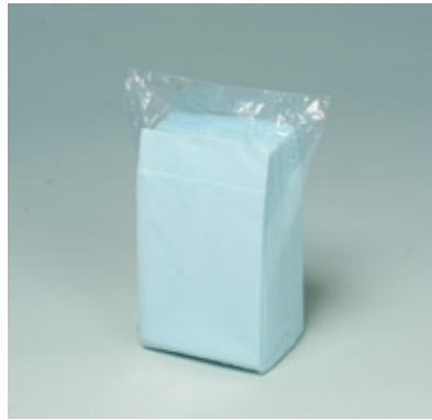
商品 CD : 902585 名称 : カラーナプキン 六ツ折(ブルー) 入数 : 500枚パック(10 パック 5,000枚) 原紙 SIZE : 250×250mm