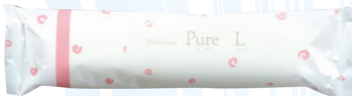
商品CD : 374211 品番 : M-21 商品名 : フレッシュメイト ピュア [丸] Lタイプ 入数 : 800 原紙SIZE : 250×320mm