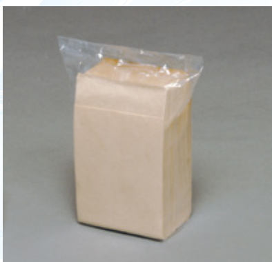
商品 CD : 31225 名称 : 六ツ折 新未晒 入数 : 10,000 (100×100) 原紙 SIZE : 250×250mm