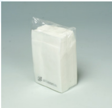
商品 CD : 31718 名称 : 六ツ折 ミルカ 入数 : 10,000 (100×100) 原紙 SIZE : 250×250mm