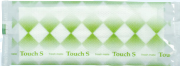
商品CD：371399 品番：T-6 商品名：フレッシュメイト タッチS [平] 入数：2,000 原紙SIZE：145×220mm