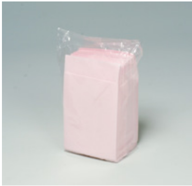
商品 CD : 902584 名称 : カラーナプキン 六ツ折(ピンク) 入数 : 500枚パック(10 パック 5,000枚) 原紙 SIZE : 250×250mm