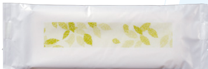
商品CD : 374234 品番 : J-2 商品名 : フレッシュメイト ステアラ [平] 入数 : 1,000 原紙SIZE : 185×260mm