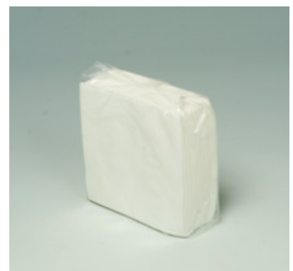
商品 CD : 31200 名称 : 四ツ折 入数 : 10,000 (100×100) 原紙 SIZE : 250×250mm