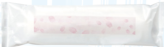
商品CD : 374233 品番 : J-1 商品名 : フレッシュメイト ステアラ [丸] Lタイプ 入数 : 800 原紙SIZE : 250×320mm