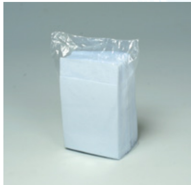
商品 CD : 902588 名称 : カラーナプキン 六ツ折(パープル) 入数 : 500枚パック(10 パック 5,000枚) 原紙 SIZE : 250×250mm