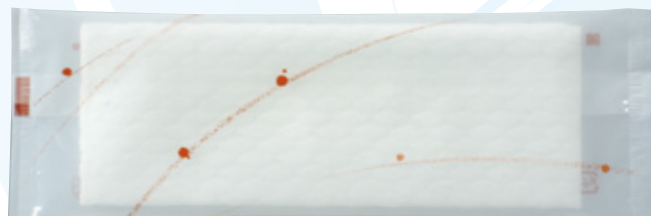
商品CD : 374202 品番 : P-2 商品名 : フレッシュメイト ピュア [平] 入数 : 1,200 原紙SIZE : 185×260mm