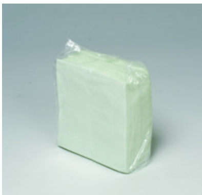
商品 CD : 902592 名称 : カラーナプキン 四ツ折(グリーン) 入数 : 500枚パック(10 パック 5,000枚) 原紙 SIZE : 250×250mm