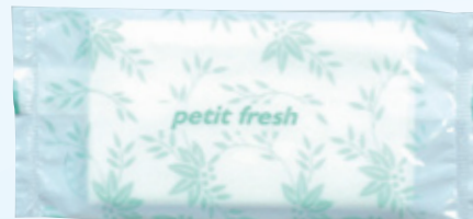
商品CD：371382 品番：M-2 商品名：フレッシュメイト プチフレッシュ [平] 入数：2,000 原紙SIZE：130×160mm