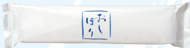
商品CD : 374221 品番 : M-27 商品名 : フレッシュメイト ピュア [丸] おしぼり柄 入数 : 1,000 原紙SIZE : 250×200mm