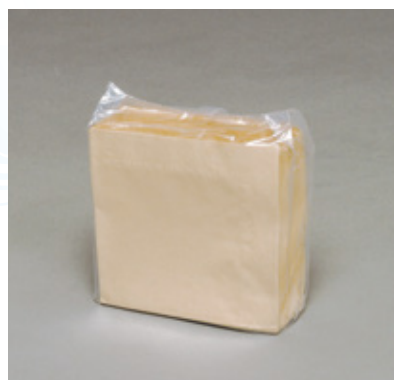
商品 CD : 31221 名称 : 四ツ折 新未晒 入数 : 10,000 (100×100) 原紙 SIZE : 250×250mm