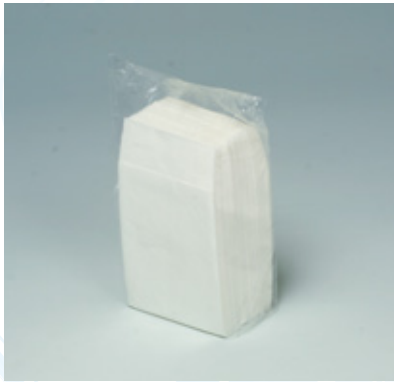
商品 CD : 0031000 名称 : 六ツ折 入数 : 10,000 (100×100) 原紙 SIZE : 250×250mm