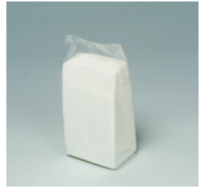
商品 CD : 31201 名称 : 新四ツ折 入数 : 15,000 (150×100) 原紙 SIZE : 165×250mm