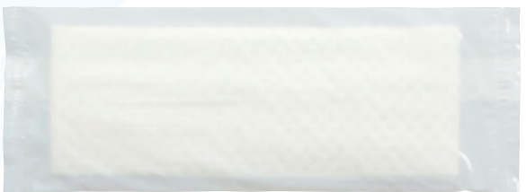
商品CD : 371397 品番 : FM-4 商品名 : フレッシュメイト 紙タイプ [平] 乳白無地 入数 : 2,000 原紙SIZE : 185×220mm